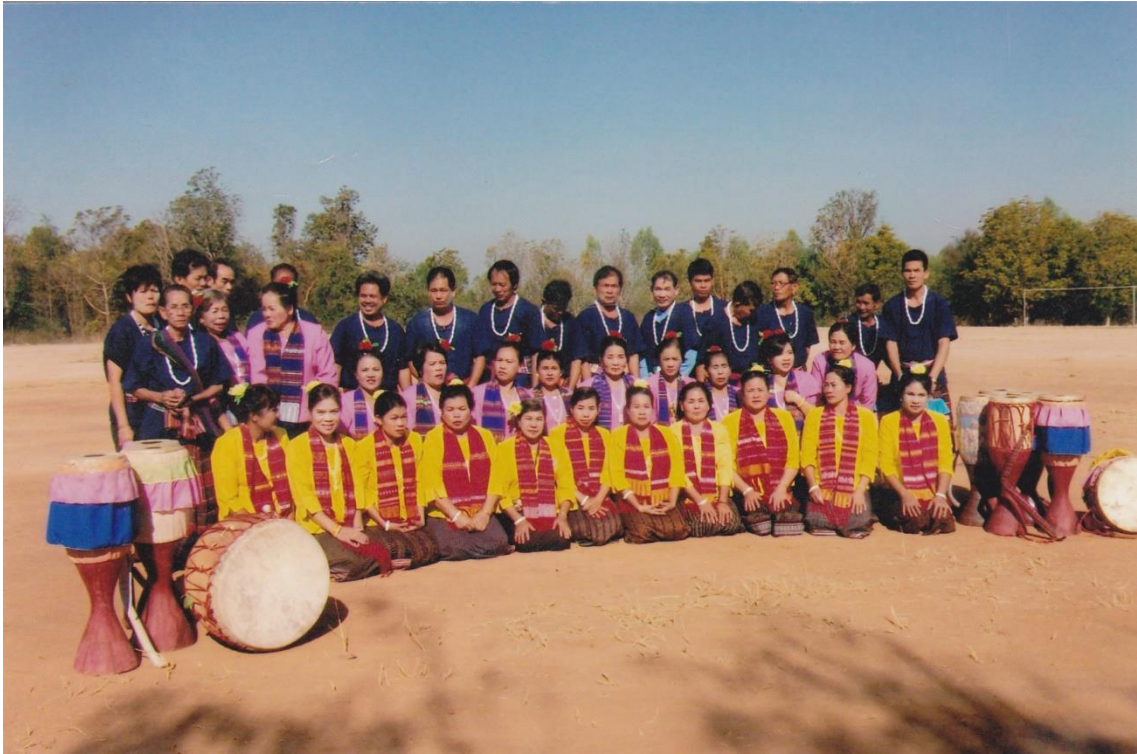
คณะกลองยาว ห้วยสะเด็ด บ้านขามป้อม หมู่ที่ ๑ ตำบลขามป้อม อำเภอพระยืน จังหวัดขอนแก่น