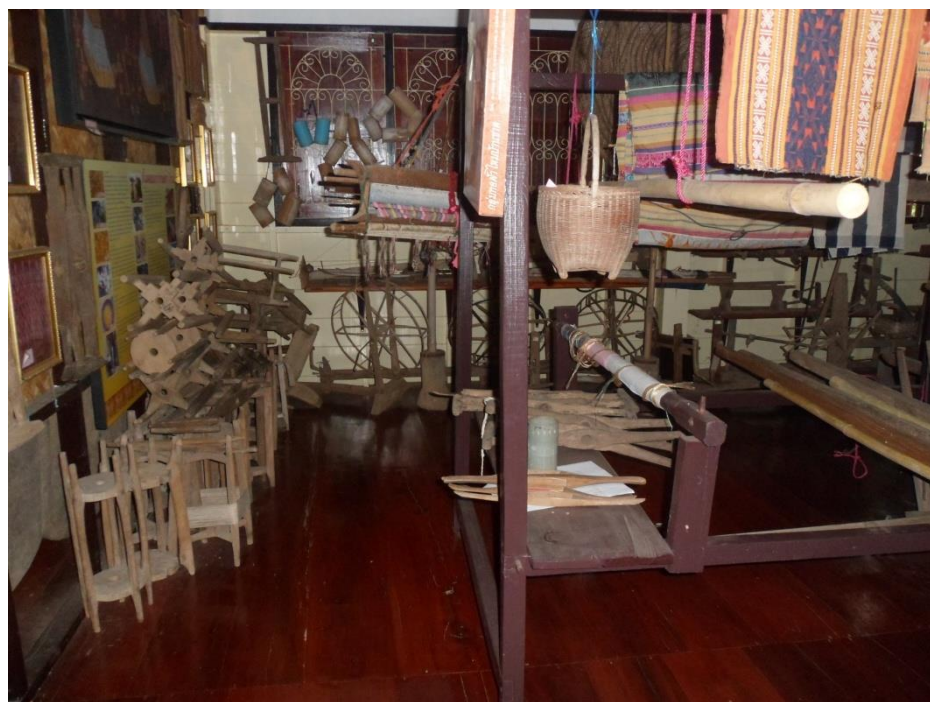
สิ่งของเครื่องใช้ในการทอผ้าของชาวบ้านในเขตตำบลขามป้อม อำเภอพระยืน จังหวัดขอนแก่น