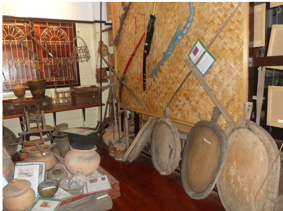
เครื่องมือทำมาหากินและอุปกรณ์ในการหุงหาอาหาร ของชุมชนบ้านขามป้อม ตำบลขามป้อม อำเภอยะยี่น