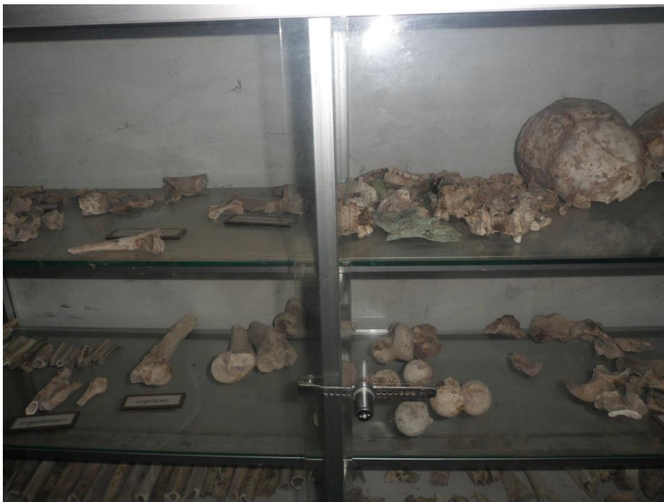
วัตถุโบราณที่จัดแสดงไว้ ณ พิพิธภัณฑ์ชุมชนวัดสระโนน ตำบลขามป้อม อำเภอพระยืน จังหวัดขอนแก่น